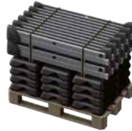
Palets estándar 120x80cm